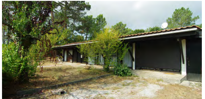
▲ Paysages se reflétant dans les vitrages