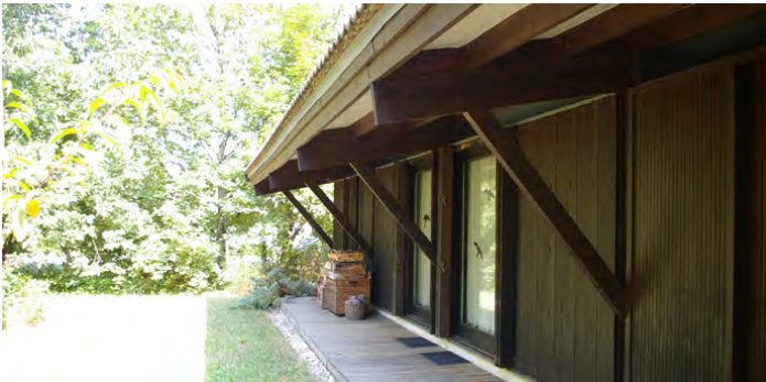
▲ Rythme donné en terrasse par l'ossature bois