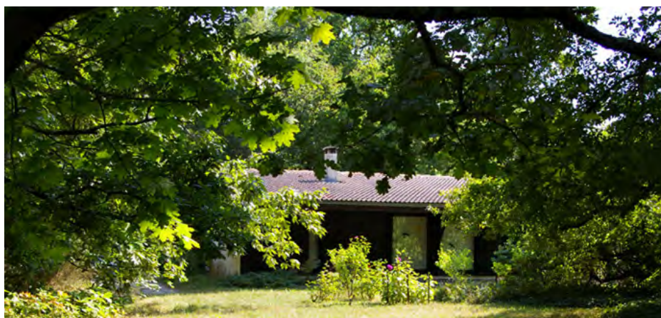
▲ Girolle noyée dans la forêt