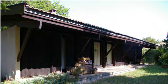
▲ Façade Sud vitrée et protégée par l'avant-toit débordant

Salier, Courtois, Lajus, Sadirac, Fouquet Atelier d'architecture Bordeaux 1950-1970 catalogue / 1995 / ARC EN REVE