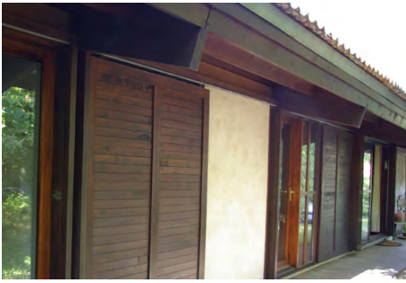
▲ Murs latéraux maçonnés jusqu'à 2 m surmontés d'une ossature bois préfabriquée