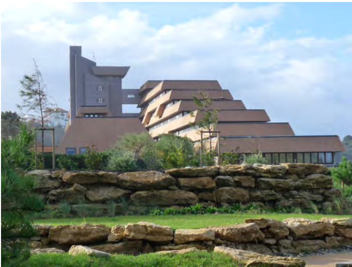
▲▲ Un dialogue entre lignes horizontales et verticales

DELORME Franck, « Résidence de la Chambre d'Amour », Le Festin , Hors Série « Le Pays Basque, 101 sites et monuments », p. 44