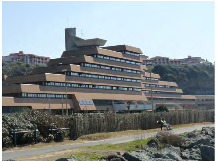
▲ Entre falaise et océan, le bâtiment accompagne le mouvement du site