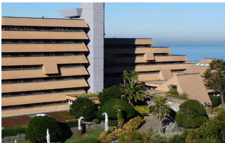
▲ Un trait architectural qui deviendra la signature des architectes A. GRESY et J-R. HEBRARD